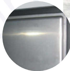
Türinnenbombe (Stromeinsparung) Magnetdichtung gesteckt, leicht auswechselbar